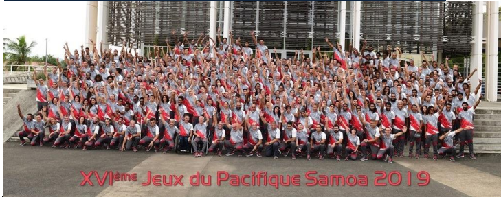
XVI ème Jeux du Pacifique Samoa 2019